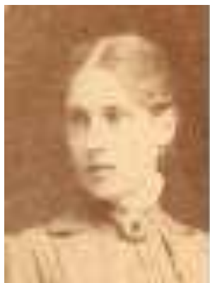
zdjęcie z ok. 1885 r.