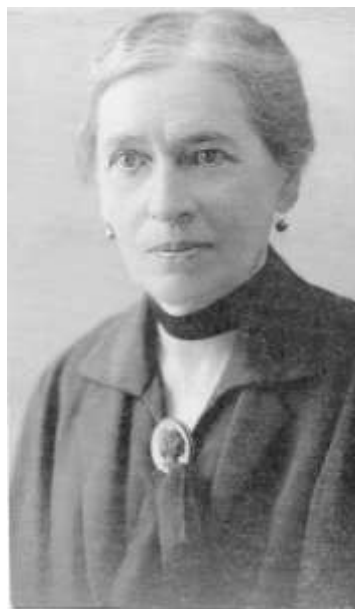
zdjęcie z 1938 r.