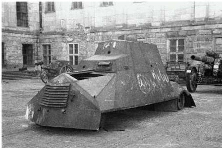
Samochód pancerny "Kubuś"