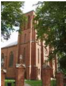
Kościół św. Kazimierza w Komajach (wygląd współczesny)

- ochrzczony w kościele parafialnym p.w. św. Kazimierza w Komajach