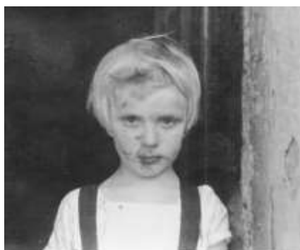
po zabawie kolorowymi kredami do znakowania drewna (od „pilszczyków”)