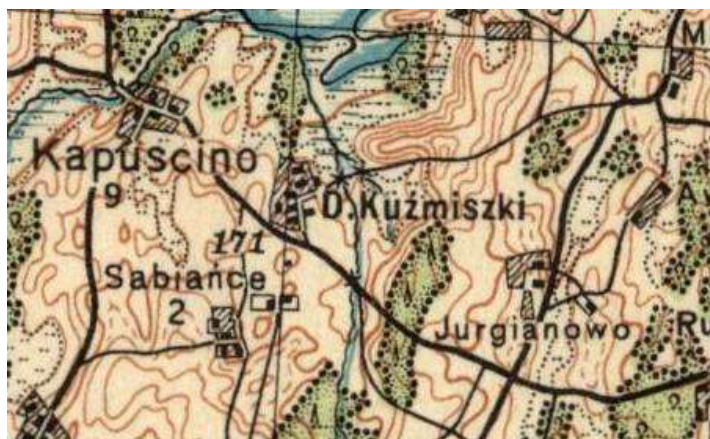
Mapa P26 S42