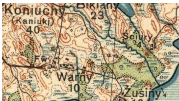
Mapa P26 S43