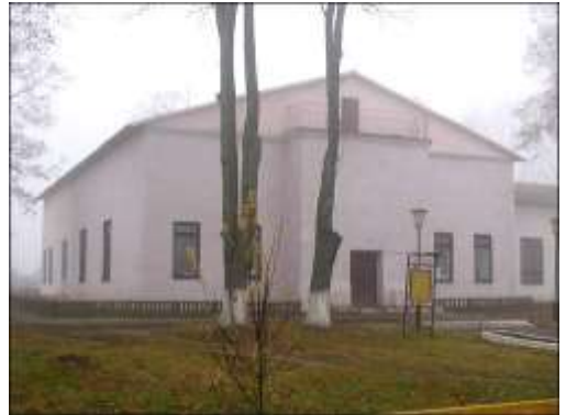
Kościół pw. Zdjęcia z Krzyża Zbawiciela w Hrozowie (stan obecny)

Hrozów , dobra w pln. stronie pow. słuckiego; folw. ok. 1180 mr. [Sul]