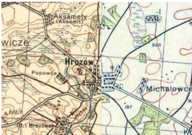
Mapa P36 S44

- posiadał majątek Hrozów w woj. nowogródzkim