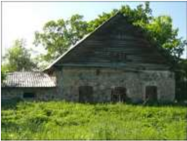
Fragment folwarku Remejkiszki (stan obecny)