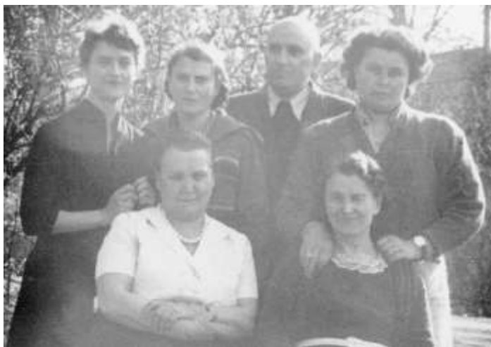
Kępno, ok. 1955 r.

dokąd rodzina przeprowadziła się w 1953 r.