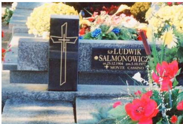
Grób Ludwika Salmonowicza na cmentarzu w Kępnie