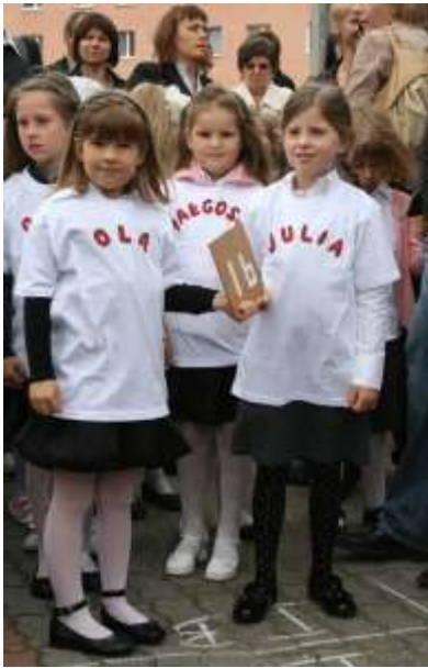
Pierwszy dzień w szkole... 1 IX 2010 r.