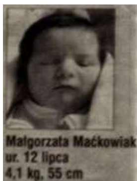
„Gazeta Olsztyńska” z dn. 16.07.2004 r. (dodatek „Olsztyn dzień po dniu”)