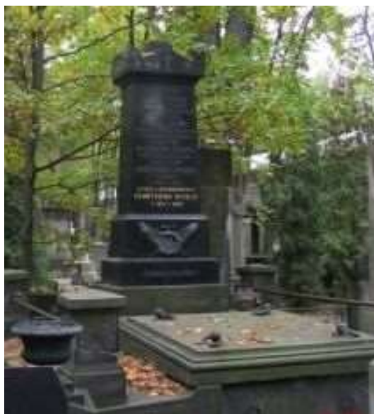
Nagrobek rodziny Wizbek (Powązki, kwat. 10)

„Gazeta Warszawska” Nr 160 z dnia 17 Lipca 1863 r.: