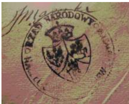
Pieczęć Rządu Narodowego Powstania Styczniowego

[www.powstanie1863.muzeumhistoriikielc.pl]