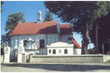
Kościół p.w. Świętych Szymona i Judy Tadeusza w Dmeninie