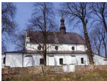
Kościół pw. św. Jacka i św. Katarzyny Aleksandryjskiej w Odrowązu (stan obecny)

Leopoli 15. Octobz 1807. (-) podpis nieczytelny