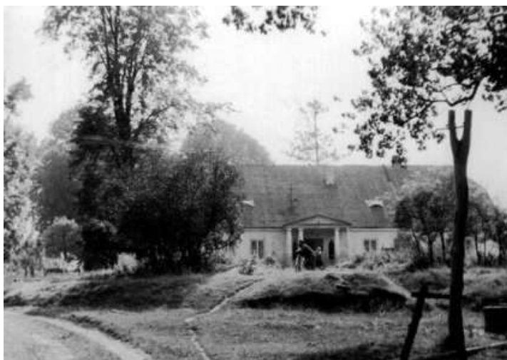
Dwór w Kraśnicy (ok. 1930 r.)