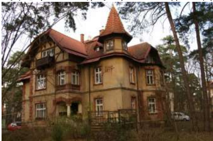
Willa „Gryf” w Konstancinie