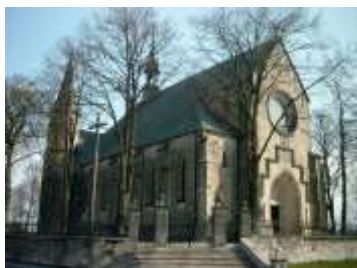
Kościół p.w. św. Mikołaja w Żarnowie (wygląd współczesny; fragmenty z XII w.)

Żarnów, miasteczko, pow. opoczyński, gm. Topolice (16 w. od Opoczna). Kościół paraf. p.w. Wniebowzięcia N.P.M. i św. Mikołaja [Sul]