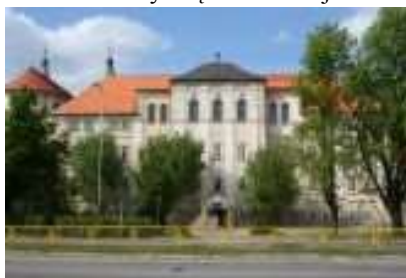
Obecny widok szkoły (o szkole – patrz http://www.chrobry110.pl )

- od 1847 r. uczył się w Gimnazjum Gubernialnym w Piotrkowie [patrz: dok. 53a]