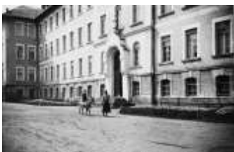
Szkola ss. Sacré Coeur w Zbylitowskiej Górze

- następnie uczyła się w gimnazjum ss. Sacré Coeur w Zbylitowskiej Górze, (k. Tarnowa) gdzie zdała maturę w 1928 r.