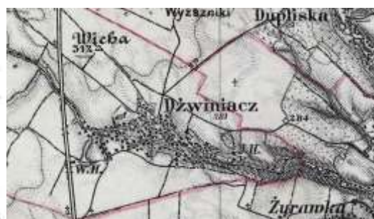
Mapa z 1874 r.

Dźwiniacz, wś, pow. zaleszczycki (8 km na półn. od Zaleszczyk) [Sul]