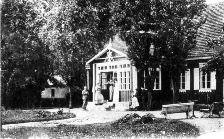
Dwór w Gudziszkach (zdjęcie z ok. 1890 r.)