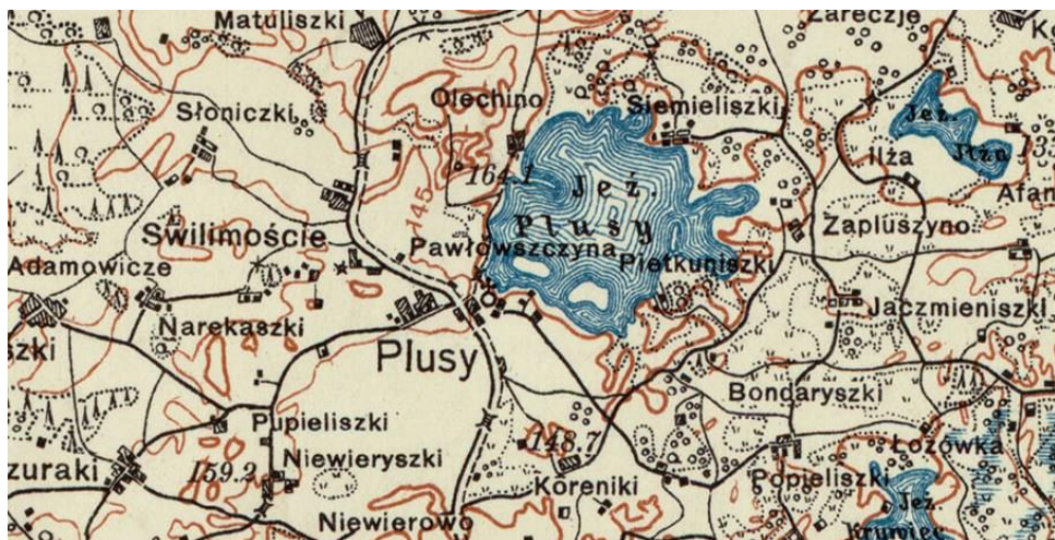
mapa A25 B44