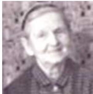
ok. 1965 r.

Wieloborowice, wś ok. 2 km na wsch. od Chybyc