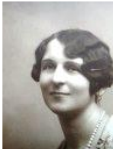
ok. 1915 r.