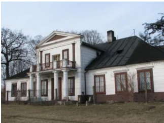
dwór w Trzepnicy (stan obecny)