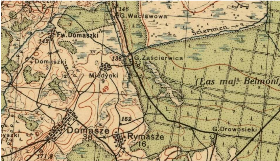
mapa Pas 26 Słup 44

Domaszewicze = Domasze , wś, dawny powiat brasławski; w 1712 r. starostwo Domasze liczyło 12 dymów hybernowych, posiadał je Wawrzęcki, potem Rudomina; w 1712 r. płaćo 322 zł. - wś pow. dzisieński, gm. Bohiń; dawniej ststwo, dziś Feliksa Platera. [wg Sul]