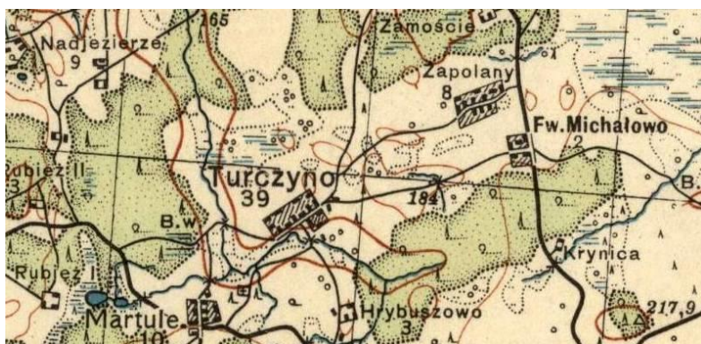
Mapa Pas 28 Słup 45

- posiadał majątek Michałowo w pow. wilejskim: 58 dusz męskich, 57 dusz żeńskich (w 1838 r.)