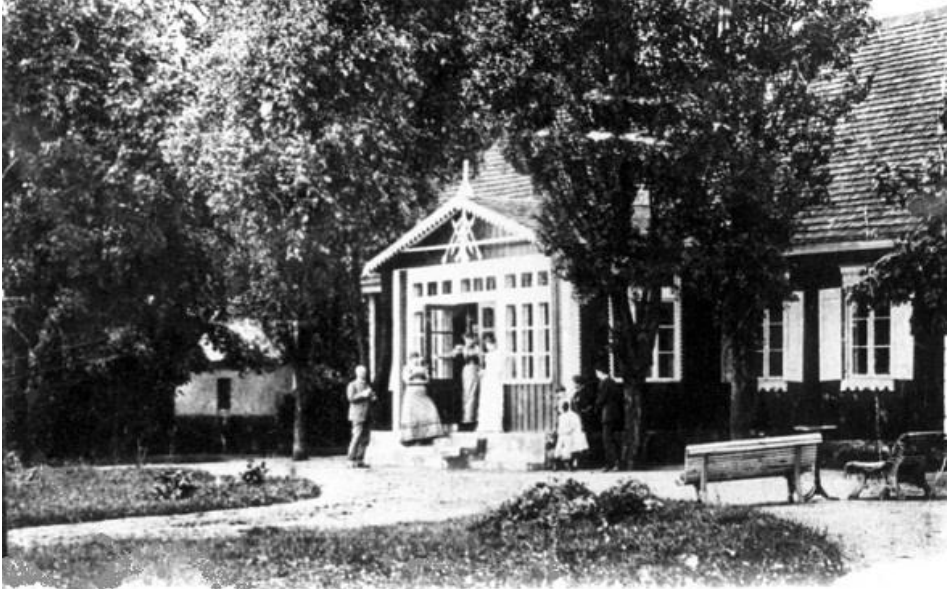
Dwór w Gudziszkach (zdjęcie z ok. 1885 r.)