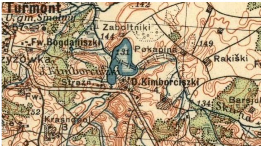
Mapa P26 S 43