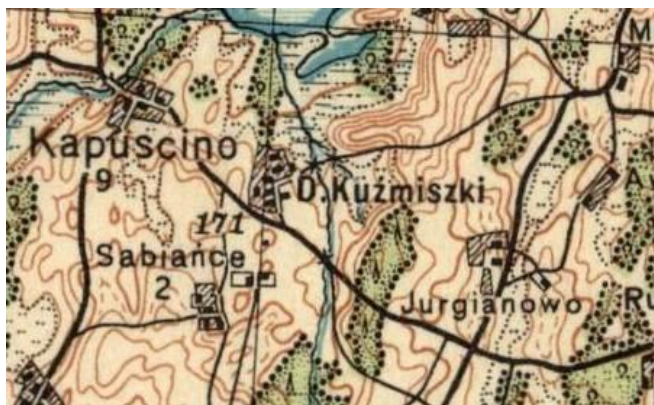
Mapa P26 S42