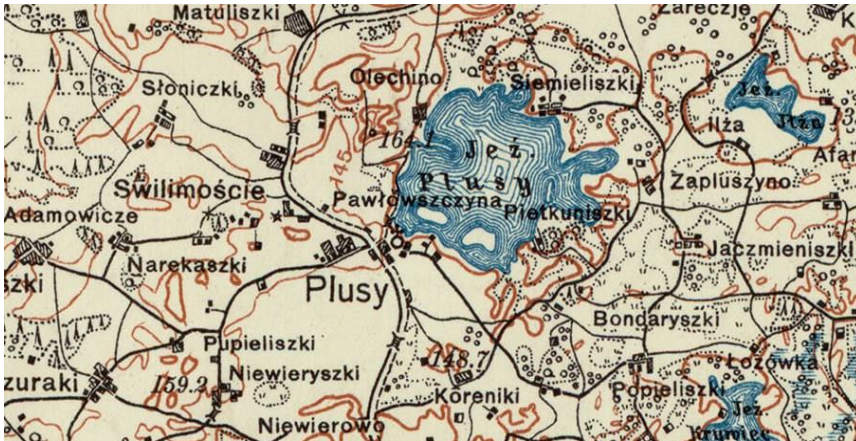
mapa A25 B44