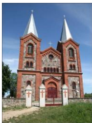
Kościół p.w. św. Trójcy w Plusach; stan obecny

- w 1770 r. ufundował w Plusach kościół filialny par. brasławskiej [SGKP t. 8, s. 271]