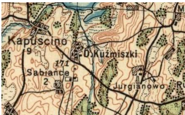
Mapa P26 S42