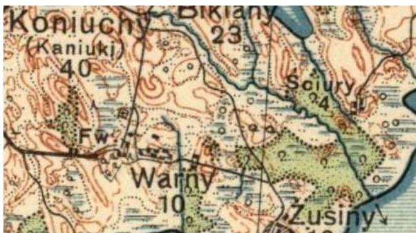
Mapa P26 S43

Kuzmiszki dwór, dobra, gm. Dusiaty (5 w.), pow. Jeziorosy; własność niegdyś Zabłockich, później Salmonowiczów, dziś Mińskich. Do dworu Kuzmiszki należą: Warny al. Warno, wieś, gm. Dukszty, pow. Jeziorosy, dawniej Salmonowiczów, dziś Mińskiego. – Ściury, wieś, gm. Dukszty, pow. Jeziorosy. [Sul]