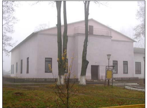
Kościół pw. Zdjęcia z Krzyża Zbawiciela w Hrozowie (stan obecny)

Hrozów , dobra w pln. stronie pow. słuckiego; folw. ok. 1180 mr. [Sul]