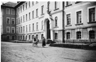
Szkoła ss. Sacré Coeur w Zbylitowskiej Górze

- następnie uczyła się w gimnazjum ss. Sacré Coeur w Zbylitowskiej Górze, (k. Tarnowa) gdzie zdała maturę w 1928 r.