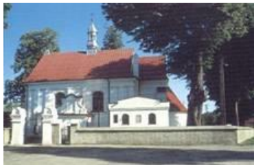
Kościół p.w. Świętych Szymona i Judy Tadeusza w Dmeninie [stan obecny]