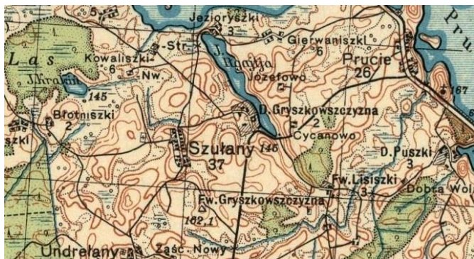
mapa P27 S43