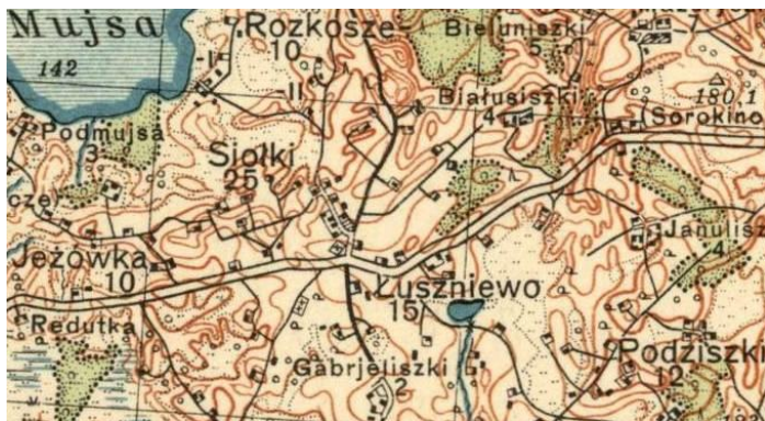
mapa P26 S43

* 1 włoka chełmińska (staropolska – 1819 r.) = 30 morg = 17,955 ha