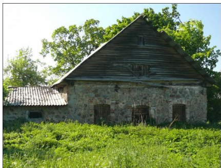
Fragment folwarku Remejkiszki (stan obecny)

*) patrz: http://pl.wikipedia.org/wiki/Dominik_Hieronim_Radziwi%C5%82%C5%82