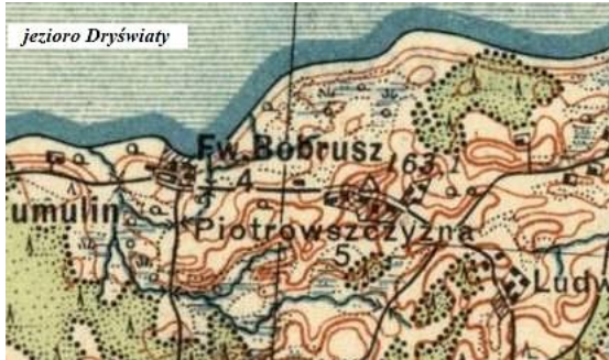
mapa P26 S43

- „(...) Felicyan Salamonowicz w Roku 1795 w Skazie szlacheckiej przy majątku Bobruysza był zapisany. (...)” [WywK]