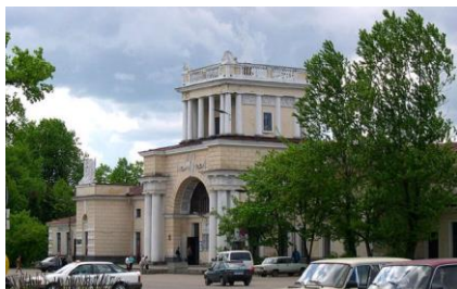
dworzec w m. Ługa – stan obecny

Ługa, miasto w Rosji, 136 km na pld. od Petersburga