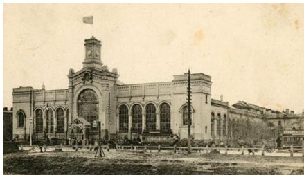
zdjęcia z ok.1900 r.

- budynek dworca kolejowego „Warszawa” w Sankt Petersburgu (przebudowany w l. 1858-1860)