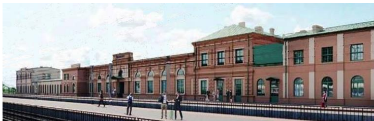
dworzec w Białymstoku, zbud. 1861 r.

- dwa domy mieszkalne (budowane w l. 1860-1890) dla pracowników budujących Kolej Petersbursko-Warszawską