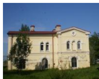
dworzec stacji Aleksandrowska w Petersburgu i budynki pomocnicze tej stacji – budowa w l. 1860-69