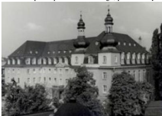
szpital p.w. św. Antoniego, Warszawa, ul. Goszczyńskiego 1 [lata 30-te XX w.]

- zmarł w szpitalu p.w. św. Antoniego, prowadzonym przez Zgromadzenie Sióstr Św. Elżbiety w Warszawie, ul. Goszczyńskiego 1