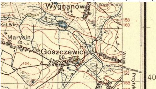
mapa P43 S31

Goszczewice , ws i folw. nad rz. Radomką, pow. radomski, gm. Przytyk par. Wzros [Sul].