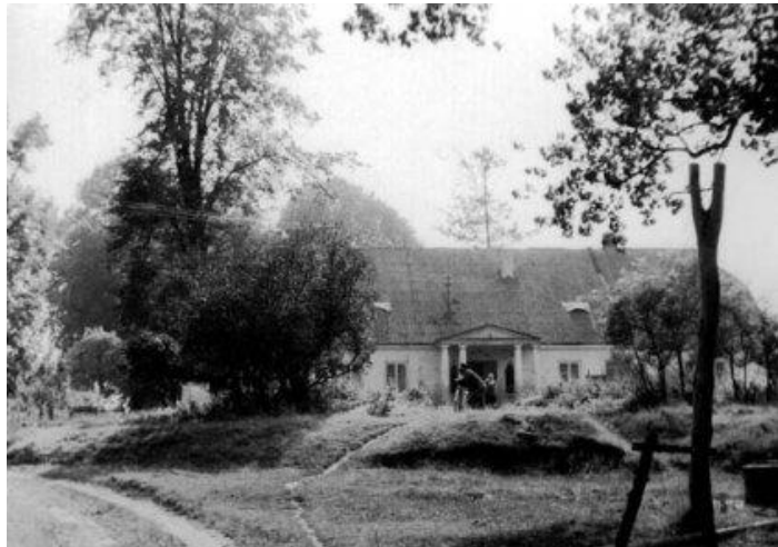
Dwór w Kraśnicy (ok. 1930 r.)