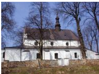
Kościół pw. św. Jacka i św. Katarzyny Aleksandryjskiej w Odrowążu (stan obecny)

Leopoli 15. Octobż 1807. (-) podpis nieczytelny