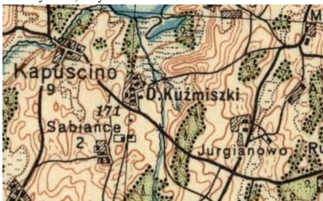
Mapa P26 S42