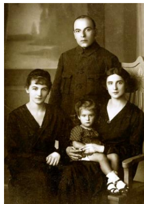
Kowno, z rodziną