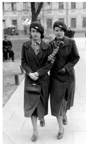
(maturzystki 1939 r.)