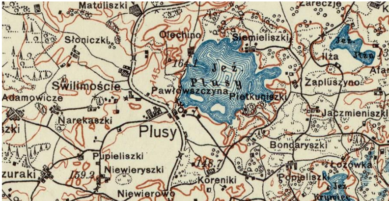
mapa A25 B44