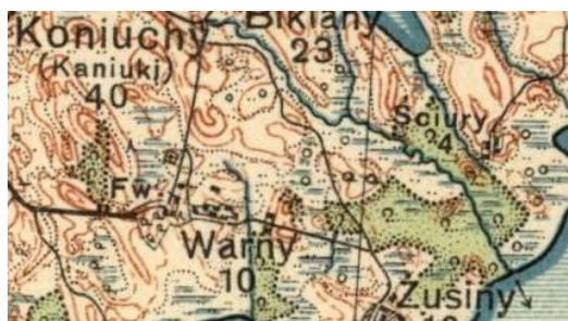
Mapa P26 S43

Kuzmiszki dwór, dobra, gm. Dusiaty (5 w.), pow. Jeziorosy; własność niegdyś Zabłockich, później Salmonowiczów, dziś Mińskich. Do dworu Kuzmiszki należą: Warny al. Warno, wieś, gm. Dukszty, pow. Jeziorosy, dawniej Salmonowiczów, dziś Mińskiego. – Ściury, wieś, gm. Dukszty, pow. Jeziorosy. [Sul]