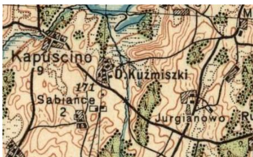
Mapa P26 S42