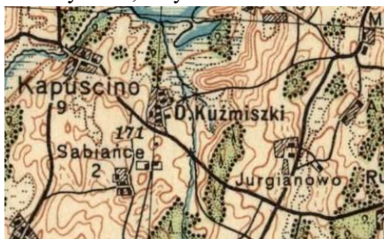
Mapa P26 S42