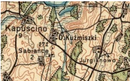
Mapa P26 S42