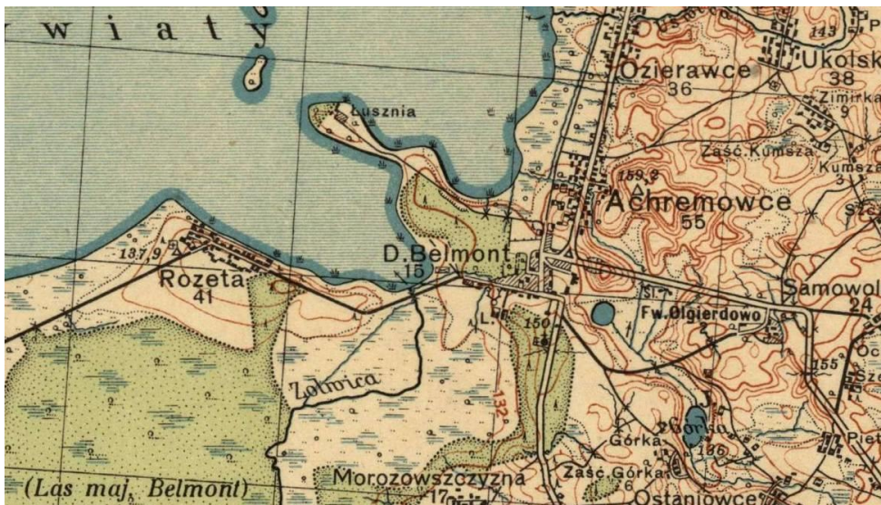
Mapa P26 S44