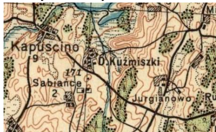
Mapa P26 S42