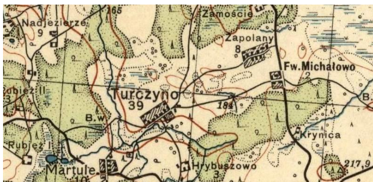
Mapa Pas 28 Słup 45

- posiadał majątek Michałowo w pow. wilejskim: 58 dusz męskich, 57 dusz żeńskich (w 1838 r.) i Turczyny