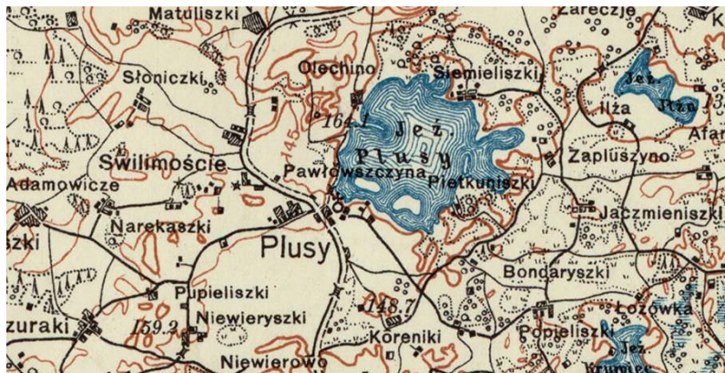
mapa A25 B44