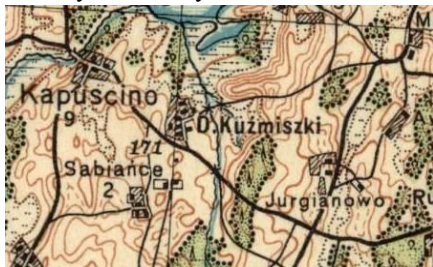
Mapa P26 S42