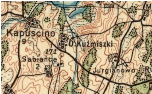
Mapa P26 S42