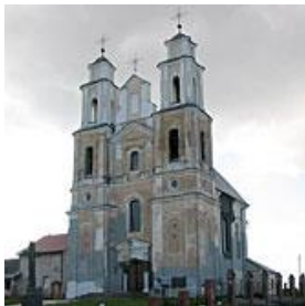
Kościół parafialny p.w. Przemienienia Pańskiego z 1787 r. w Hermanowiczach